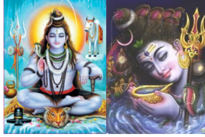
SHIVA ASHTOTHRAM (108) - TAMIL, SANSKRIT AND ENGLISH WITH MEANING

Home Pooja About Pradosham Scripts Saints What's New Why we Celebrate Temples Photo Gallery Downloads About us